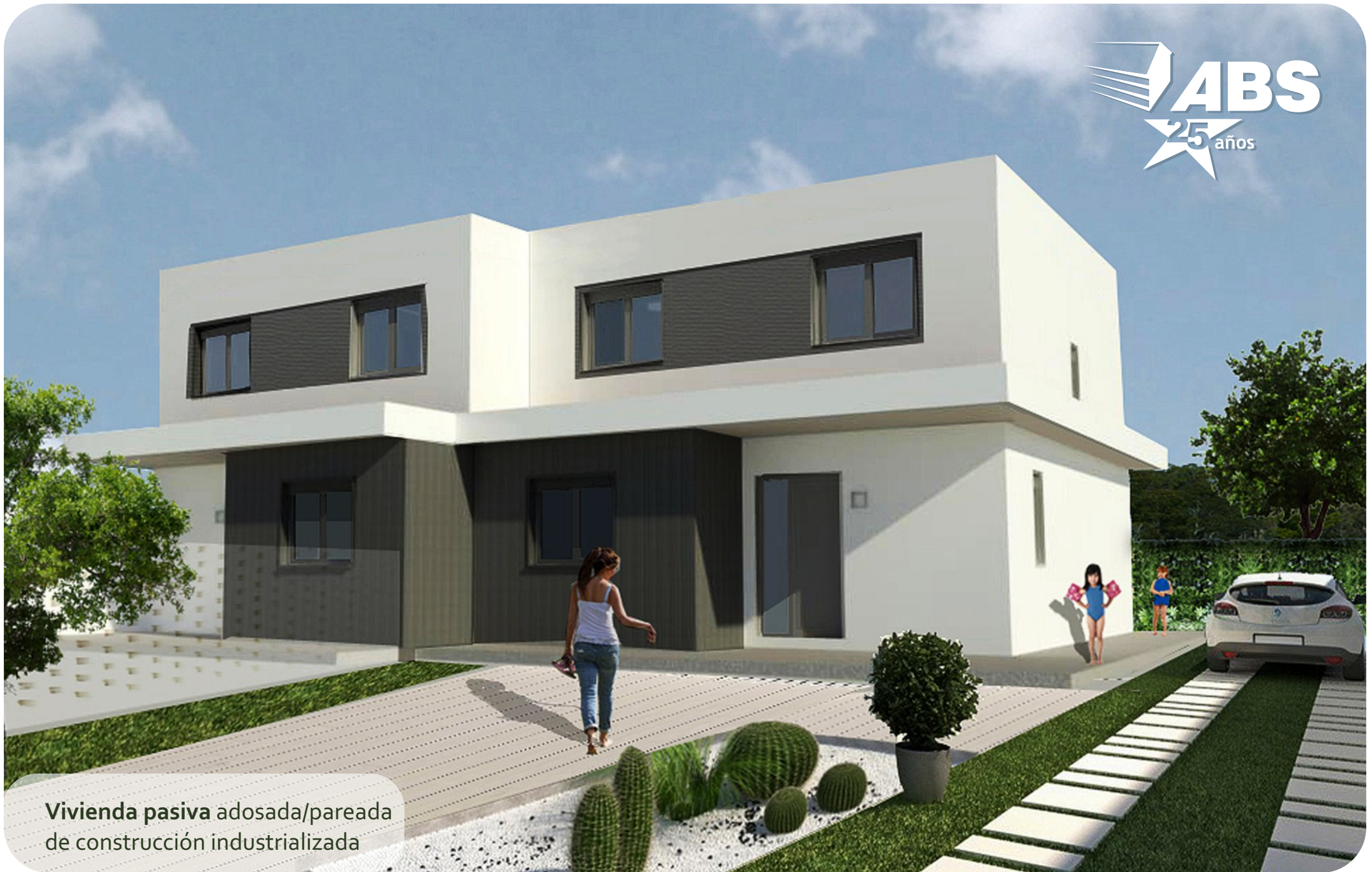
Vivienda pasiva adosada/pareada de construcción industrializada